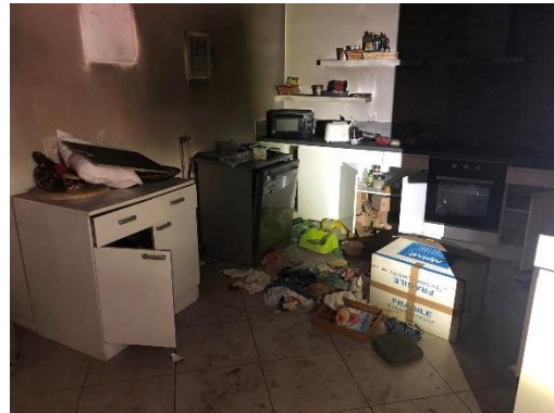
Maison Ozanam