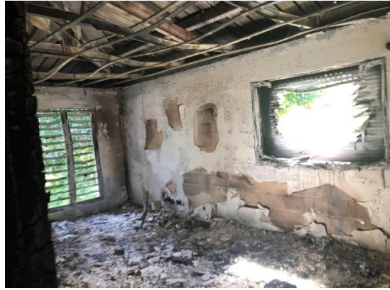
Maison Ozanam