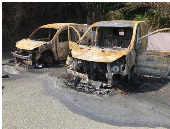
Véhicules de distribution

Cet arrêt forcé impacte les nombreuses actions solidaires portées par les soixante bénévoles de l'archipel.