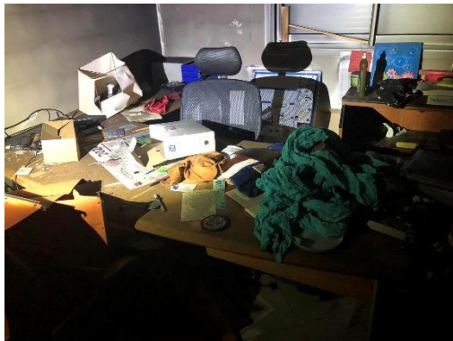
Maison Ozanam / @SSVP Nouvelle-Calédonie

Depuis ce mercredi 22 mai, une cellule de soutien psychologique en partenariat avec la Province Sud (collectivité locale) a été mise en place. Une façon d'Etre présent, tout simplement et à l'écoute des personnes fragilisées par la situation.